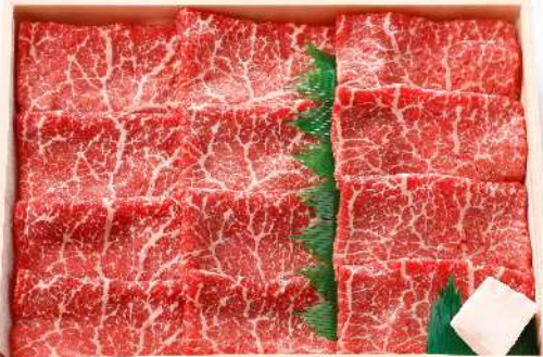
「やまぐち和牛 燦 黒毛和牛 すきやき」 有限会社 萩ミート販売