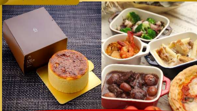
「パスクチーズケーキ&洋風オードブルセット」 シックス・コージー by 千草ホテル