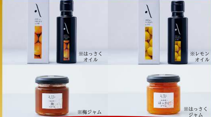
「フレーバーオイル&フルーツジャムセット」 山本倶楽部 株式会社