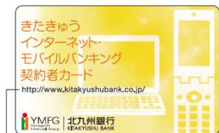
■インターネットバンキングご利用の場合のURL